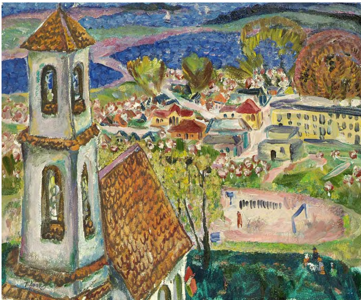
Барыс Аракчэў "Заслаўе 9 мая", кардон, алей, 1975 г.

Мінскае мора ўдалечыні выглядае, як мара, дадае краявіду казачнасці, робіць яго насычаным і завершаным. Станоўчае ўражанне ад спасціжэння дадзенага твора застаецца ва ўяўленні надоўга, што сведчыць аб дасягненні аўтарам выдатнага выніку візуалізацыі экспрэсіі.