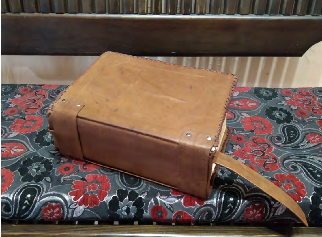
Кніга водгукаў музея-запаведніка, якая захоўваецца ў музейна-выставачным комплексе