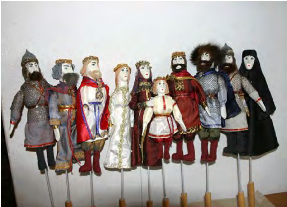
Лялькі з батлейкі музея-заповедніка

Со временем к религиозному сюжету добавились бытовые, и батлейки стали делать с дополнительными ярусами. На верхних были персонажи, жившие в раю – Святое семейство, ангелы, пастухи, волхвы, на нижних – все остальные.