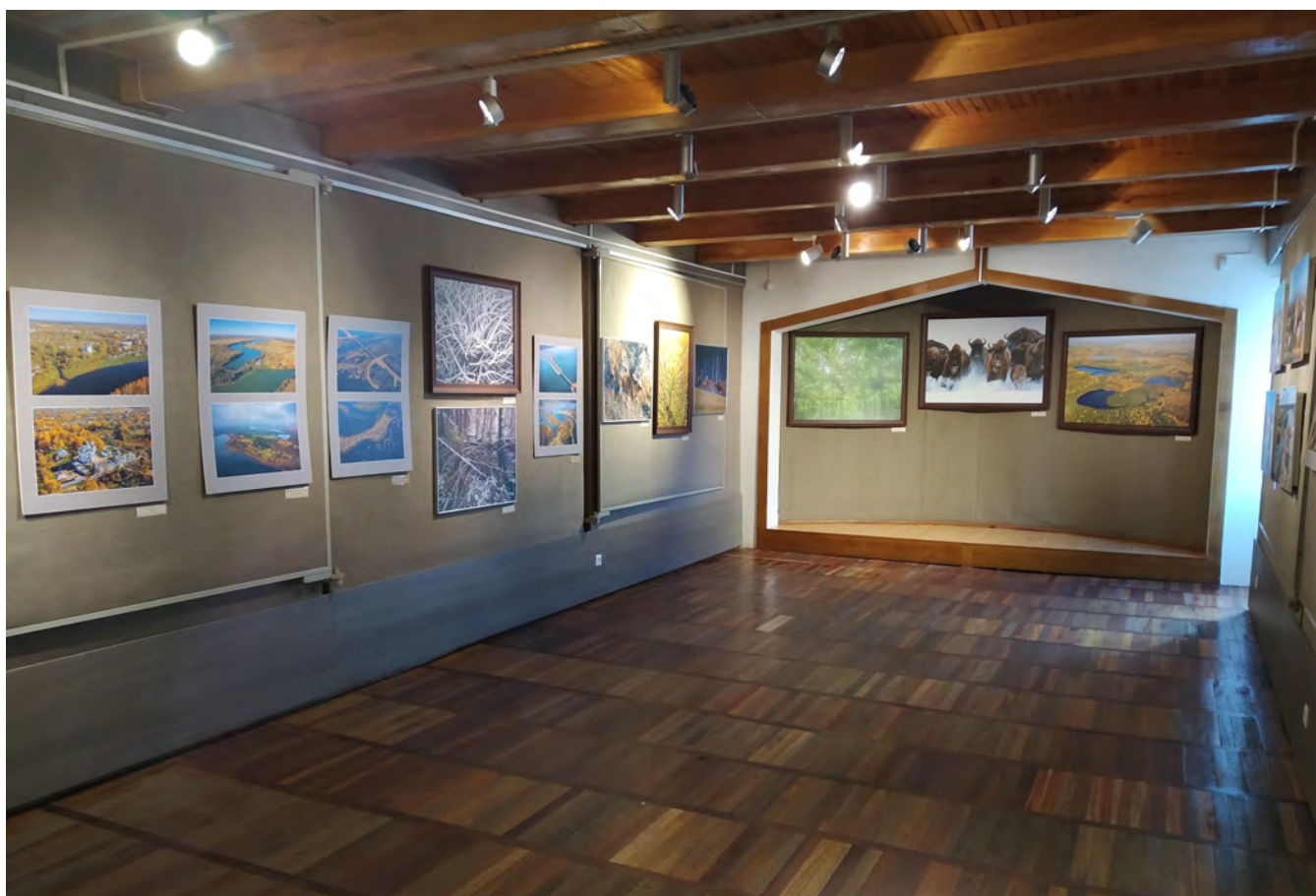
Фотавыстава “Нечаканая Беларусь” (фотаробаты Сяргея Плыткевіча)

зрабіць непаўторныя кадры з насельнікамі жывой прыроды – зьярамі і птушкамі, і, калі яны атрымліваюцца, то стаюць сапраўднымі шэдэўрамі, здатнымі здзіўляць і прыцягваць увагу шырокай аўдыторыі. Сярод фотамастакоў, як і сярод мастакоў, што працуюць за эцюднікамі, маюцца свае класікі, так бы мовіць, майстры, выбітныя творцы, пра якіх ведаюць вельмі многія людзі, шануюць іх талент, здольнасці і адметныя вынікі адлюстравання іх генія ў аўтарскіх работах. Да такіх майстроў-класікаў, без перабольшванняў і дакладна, можна аднесці творцу Сяргея Плыткевіча, які сваімі фотаробатамі здзіўляў не толькі Беларусь, але і ўвесь свет.