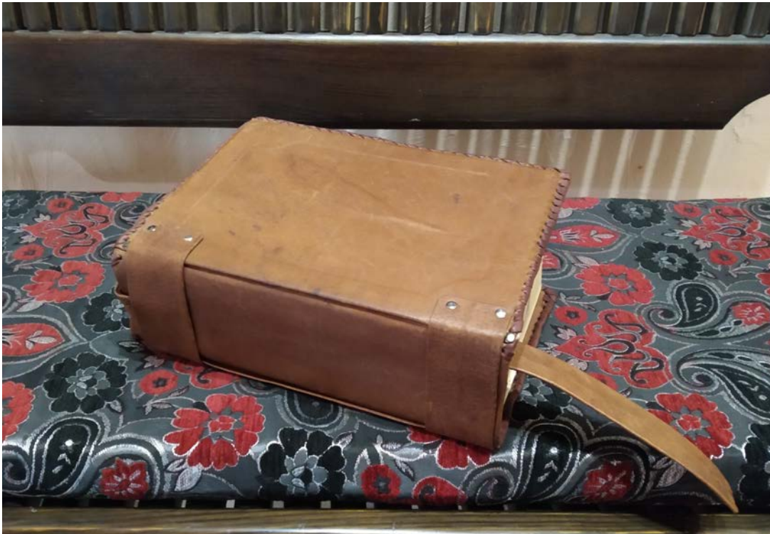
Кніга водгукаў музея-запаведніка, якая захоўваецца ў музейна-выставачным комплексе

“Было б цудоўна, каб магчыма было хоць раз на год “ажывіць” музычныя інструменты (канечне, папярэдне трохі падрамантаваць), тады б было вялікае свята – ажыўшых інструментаў музея. Дзякуй!” (каманда радыё “Марыя”, 5 мая).