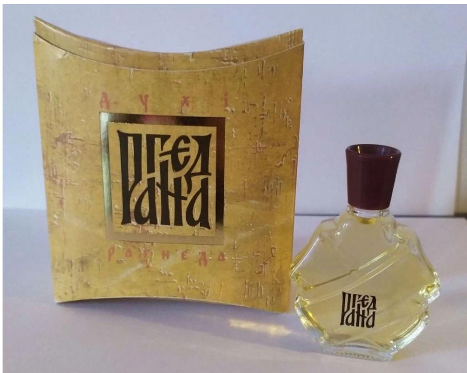
Парфума “Рагнеда”, вырабленая ТЗА “Міран-Парфума” ў 1999 г.