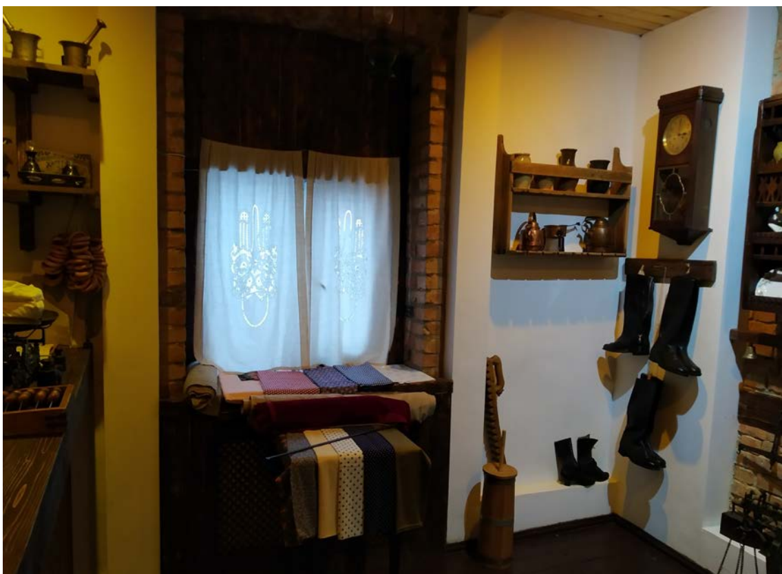
Экспазіцыя “Гандлёвая лаўка канца XIX-пачатку XX ст.” або чацвёрты зал музейна-выставачнага комплексу

Апрача таго, у склад музея-запаведніка ўваходзяць вельмі розныя па сваім тэматычным змесце аб'екты, што дае магчымасць задаволіць шырокае поле цікаўнасці наведвальнікаў: кожны можа выбраць тут нешта сваё, на свой густ і інтарэс. Аматарам народнай архітэктуры і побыту нашых продкаў дакладна да густу прыйдзецца этнаграфічны комплекс “Млын і кузня” (або “Млын”), аматарам ваеннай гісторыі – музей-ДОТ, цікаўным да міфалогіі нашых продкаў нельга прамінуць Дзіцячы музей міфалогіі і лесу, аматарам розных сваёй тэматычнай скіраванасцю часовых выстаў, народных музычных інструментаў, гандлёвай гісторыі мястэчак і гарадоў Беларусі цікава будзе наведаць музейна-выставачны комплекс. Краязнаўчы музей звычайна не можа зрабіць такой рознапланавай прапановы сваім гасцям.