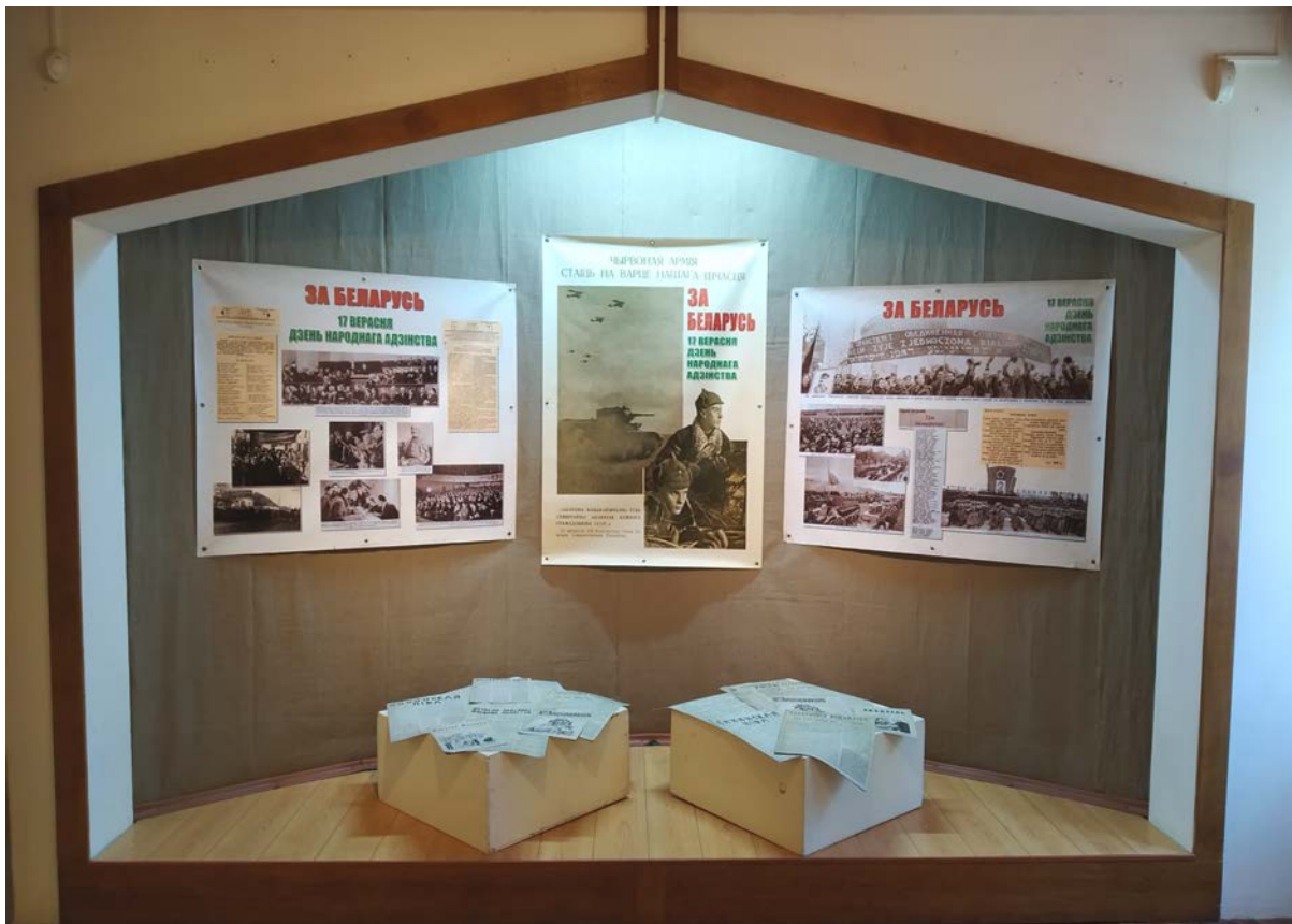
Выстава “Ты з Заходняй, я з Усходняй нашай Беларусі”

Выстава “Ты з Заходняй, я з Усходняй нашай Беларусі” з’яўляецца праектам Мінскага абласнога краязнаўчага музея. Яна прысвечана Дню народнага адзінства, які святкуецца 17 верасня. Урачыстае адкрыццё гэтага праекта, які на бягучы момант аб’ехаў усе гарады Мінскай вобласці, адбылося летась у г. Маладзечна, а гэтым часам ён завяршае сваё экспанаванне па гарадах Мінскай вобласці выставай у Заслаўі.