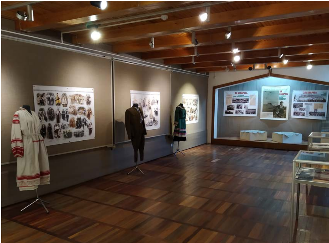
Выстава “Ты з Заходняй, я з Усходняй нашай Беларусі”

вайна, у якой Савецкая Расія пацярпела паражэнне ад Польшчы. Па ўмовах міру, падпісанага пасля гэтай вайны, пад уладу Польшчы адыйшла Заходняя Беларусь. Такім чынам, наш народ быў штучна падзелены новай дзяржаўнай мяжой. Усходняя Беларусь, у тым ліку і Заслаўе, заставалася ў складзе БССР. 1 верасня 1939 г. з нападу нацысцкай Германіі на Польшчу пачалася Другая сусветная вайна. Выстаяць у вайне супраць Германіі ў Польшчы не было шанцаў. 17 верасня Чырвоная Армія ўвайшла ў Заходнюю Беларусь – і беларусы зноў уз'ядналіся ў межах адной дзяржавы, штучны падзел нашага народа быў скасаваны.