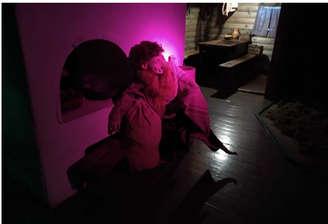
Дамавік (Хатнік) у Дзіцячым музеі маіфалогіі і лесу

Таксама варта памятаць пра тое, што ў склад музея-запаведніка з часам могуць дадавацца новыя аб'екты, у ліку якіх можа быць і музей горада, але варта сур'ёзна падумаць аб тым, у якім фармаце ён будзе існаваць, уважліва прапрацаваць усе дэталі і здабыткі сучаснай музейнай справы ў гэтым кірунку.