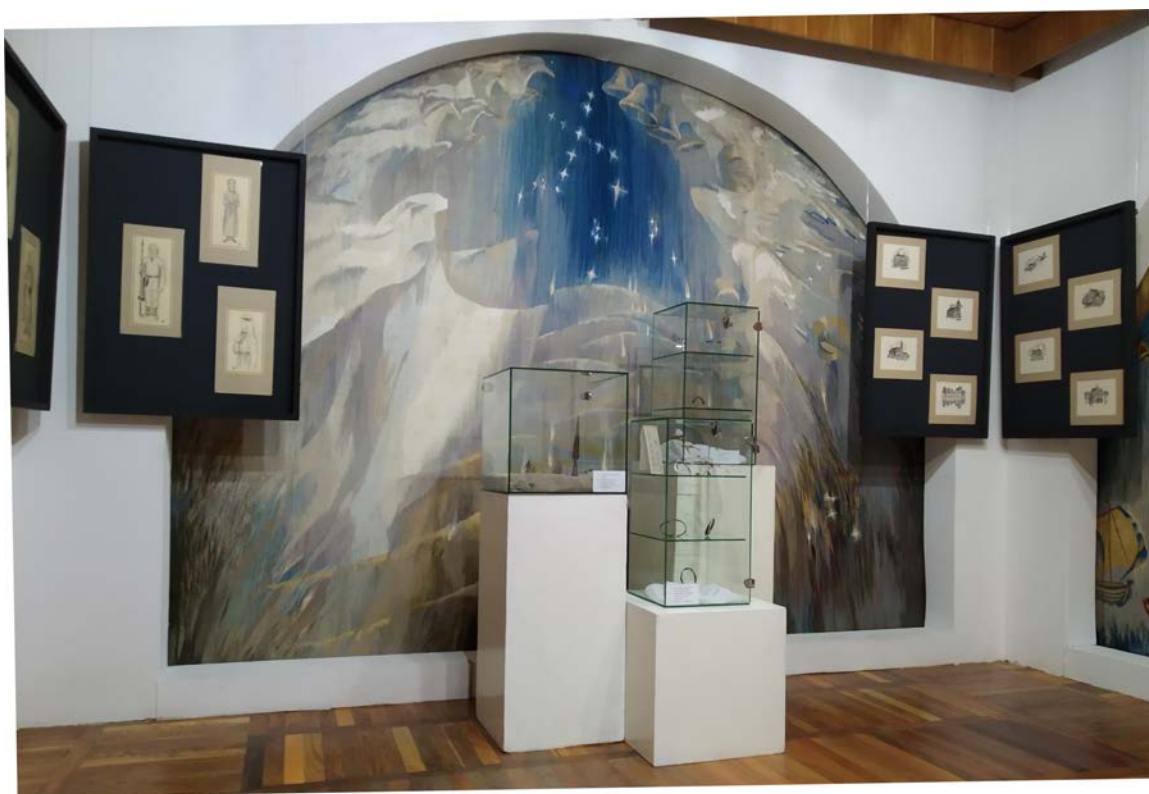
Частка праекта з арыгінальнымі археалагічнымі знаходкамі з фондаў музея-запаведніка