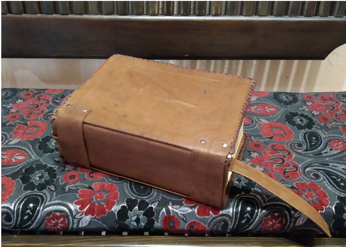
Кніга водгукаў музея-запаведніка, якая захоўваецца ў музейна-выставачным комплексе