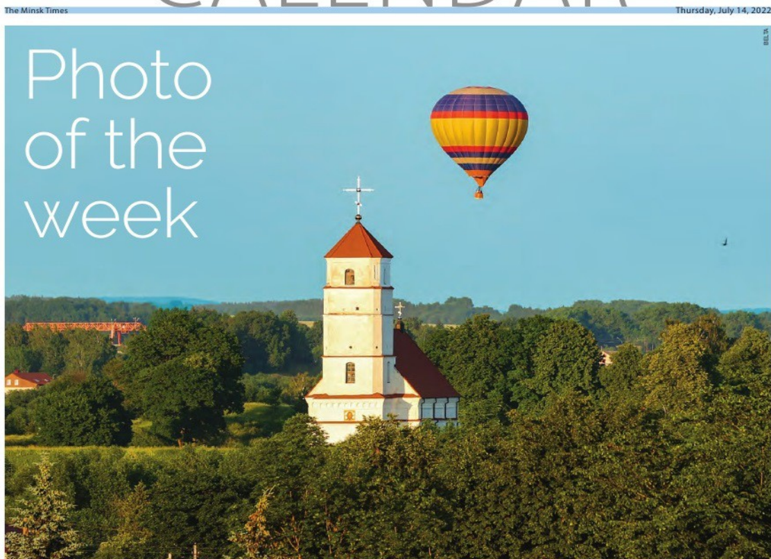
“The Minsk Times”, № 26(936) за 14 ліпеня 2022 г., фотаработа “Паветраны шар над Заслаўем”

Пра Беларусь замежныя турысты нярэдка атрымліваюць інфармацыю з англамоўных выданняў, у тым ліку – спецыяльна адрасаваных для гэтай