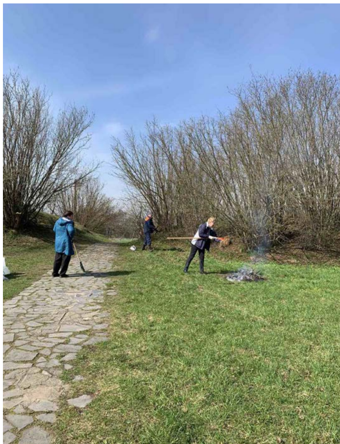
Уборка ўнутранай пляцоўкі гарадзішча “Замачак”