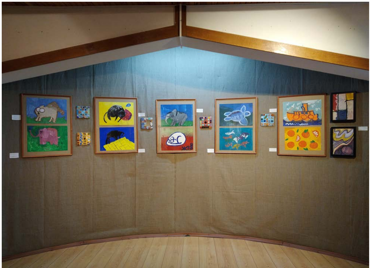
Работы воспитанников Мастерской Доброго Дела (г. Минск)

С 4 апреля по 12 мая 2023 года в Историко-культурном музее-заповеднике “Заславль” проходит выставка “Мир глазами детей”, посвящённая информированию о проблемах аутизма. Это совместный проект Мастерской Доброго Дела (г. Минск) и Заславской Детской школы искусств. На выставке представлены работы детей, все работы очень разные, при создании этого проекта хотелось уйти от метода сравнения, представить разные точки зрения и многообразие этого мира, работы детей с аутизмом могут показаться слишком наивными, но для них – это уже некий прорыв, так как не все дети с аутизмом могут держать карандаш в руке.