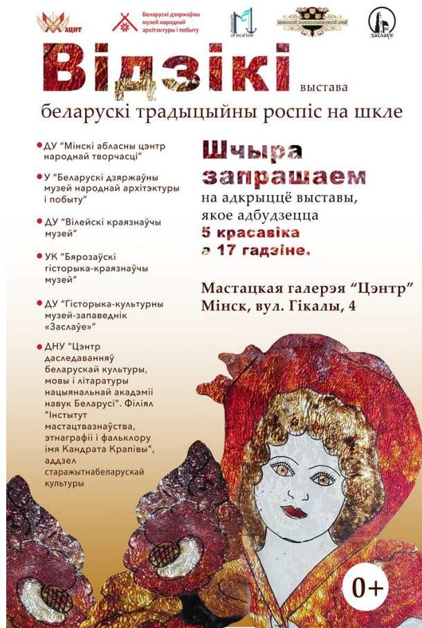
Афіцыйная афіша да выставы “Відзікі: беларускі традыцыйны роспіс на шкле”

“Відзікі” (ад слова “від”) – рэгіянальная назва роспісу на шкле. Карцінкі на шкле разам з маляванымі дыванамі, вышытымі ручнікамі і ўзорыстымі тканымі посцілкамі, фарміравалі цэласны ансамбль пасляваеннага вясковага інтэр’ера і адлюстроўвалі ўяўленні аб прыгажосці цэлага пакалення жыхароў вёскі. У экспазіцыі галерэі “Цэнтр” прадстаўлена практычна ўся відавая разнастайнасць роспісу на шкле з розных рэгіёнаў Беларусі: рамкі для фотаздымкаў і абразоў, абразы, сюжэтныя кампазіцыі розных жанраў. Роспісы створаны народнымі майстрамі ў 1920-1970-я гг.