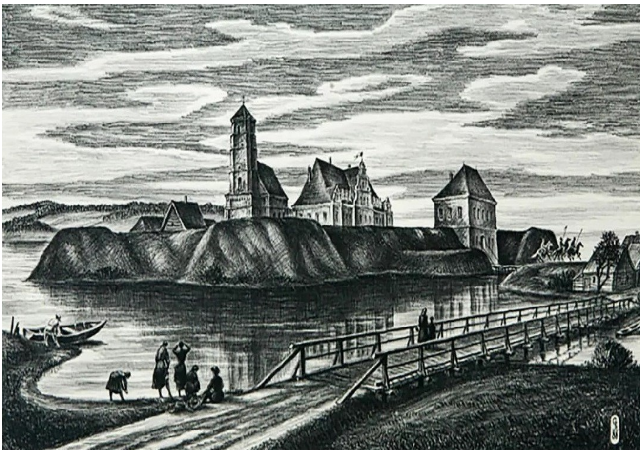
Заслаўскі бастыённы замак. Гравюра-рэканструкцыя мастака В.П. Сташчанюка

Тэза аб значным следзе Заслаўя ў беларускай культуры і гісторыі з'яўляецца бясспрэчнай і пацвярджаецца праз прызму самых розных фактаў, шэраг якіх, ужо прыводзіўся ў дадзенай рубрыцы ў папярэдніх нумарах нашай газеты. Гэтым разам мы таксама працягнем справу пашырэння ўяўлення аб адзначаным вышэй следзе. Зробім гэта на прыкладзе Заслаўскага бастыённага замка або, як яго яшчэ называюць навукоўцы, гарадзішча “Вал”.