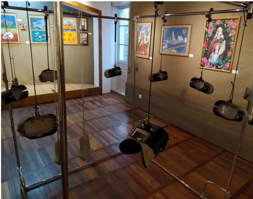
Канструкцыя з акуларамі віртуальнай рэальнасці ў зале часовых выстаў музея-запаведніка

Нядаўнім часам наш музей атрымаў арыгінальную магчымасць прадставіць сваім наведвальнікам сапраўдны спосаб спасцігаць старажытную гісторыю праз віртуальную рэальнасць. Дасягнута гэта было пры дапамозе акулараў віртуальнай рэальнасці (“VR”). У іх памяці былі размешчаны два спецыяльныя сюжэты, у якіх адлюстравана старажытнае гарадзішча або драўляны замак разам з жылымі пабудовамі (пэўная спроба прыкладнай рэканструкцыі гарадзішча “Замачак”, старажытнага Ізяслаўля), а таксама паказаны інтэр’ер такой жылой пабудовы – палаці, паліца пад посуд, посуд, печ-каменка. Кожны з сюжэтаў ажыўлены нечаканым з’яўленнем пэўных персанажаў (у замку – сабака, у жылой пабудове – пацук), што выклікана патрэбай расейвання ўвагі для большай яе засяроджанасці ў наступным, што асабліва карысна для працы з дзецьмі, увага якіх найбольш хутка расейваецца.