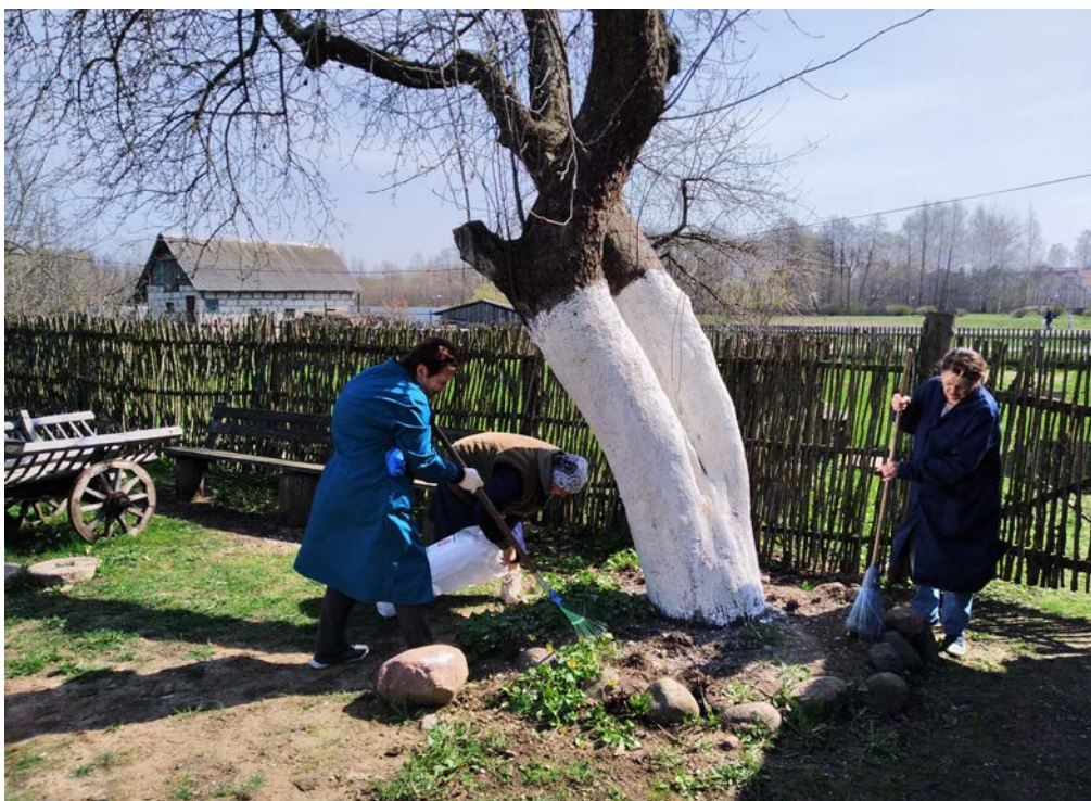
Добраўпарадкаванне на этнаграфічным комплексе

людзей мясцовых, не іначай. Калі ў наш горад прыязджаюць госці з розных гарадоў Беларусі і замежжа, робіцца крыху сорамна за падобныя ўчынкі нашых гараджан, прыходзіцца за гэта выбачацца перад турыстамі.