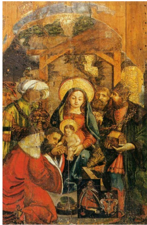
Абраз “Пакланенне вешчуноў” з Дрысвят, Браслаўскі раён, XVI ст. З’яўляецца часткай збору музея Старажытнабеларускай культуры ІМЭФ НАНБ у Мінску