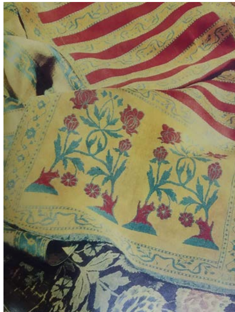
Слуцкі пояс другой паловы XVIII ст. *

слуцкія паясы другой паловы XVIII ст. і іншыя надзвычай арыгінальныя музейныя прадметы. На аснове экспазіцыі музея рамёстваў і народных промыслаў тысячы жыхароў нашай краіны знаёміліся з традыцыямі нашых продкаў, іх майстравітасцю і руплівасцю, адкрывалі для сябе Беларусь.