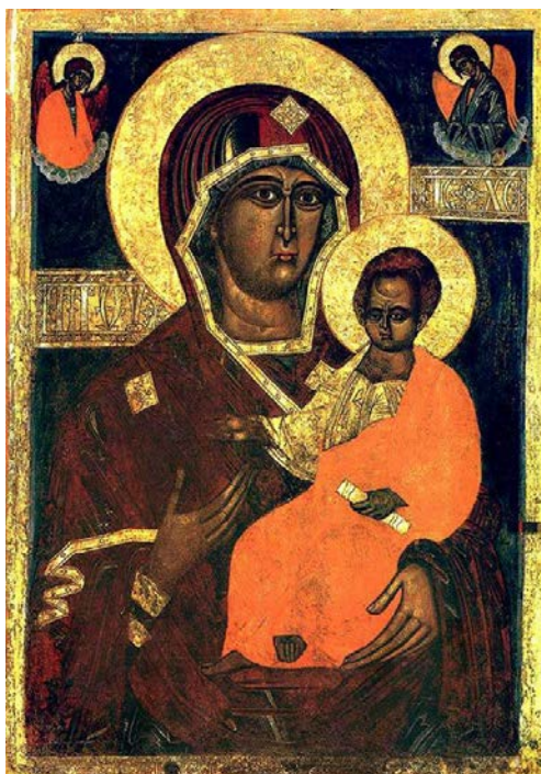
Маці Божая Адзігітрыя Смаленская, к. XV ст., фрагмент, захоўваецца ў Нацыянальным мастацкім музеі Беларусі

тэхналогію пісьма і традыцый, набылі свой нацыянальны, адметны стыль напісання абразоў. Пад уплывам рэнесансавых ідэй у беларускім іканапісе назіраюцца пэўныя зрухі: на змену вытачаных і ўмоўных вобразаў, адарваных ад рэальнасці, прыходзіць канкрэтнасць, гармонія, дасканаласць прапорцый, пластычнасць. Біблейска-іканаграфічная аснова спалучаецца з рэальнасцю вобразаў, іх прастанароднасцю, этнаграфічнымі элементамі.