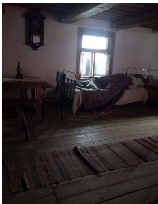
Позневечаровыя кіназдымкі на этнаграфічным комплексе. Хата “завознікаў”