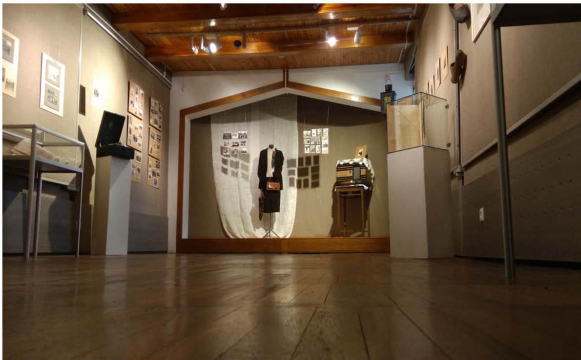
Выставачны праект “Фотагляды і нарысы Заслаўскіх абшараў. XX ст.” (агульны выгляд, фота аўтарства Ксеніі Сямашка)

Тысячагадовая гісторыя Заслаўя дый Земляў Заслаўскіх — у розныя часы дый у розных краінах. Розныя абшары ды розныя статусы. Вывучаць заслаўскую гісторыю можна толькі па гісторыі гэтых абшараў ды па іх назвах. Дый гісторыю самой Беларусі, якая бы ў люстэрку тут адбілася — усю мінуўшчыну краіны дый цяперашні час можна зразумець, зірнуўшы ў тое мінулае.