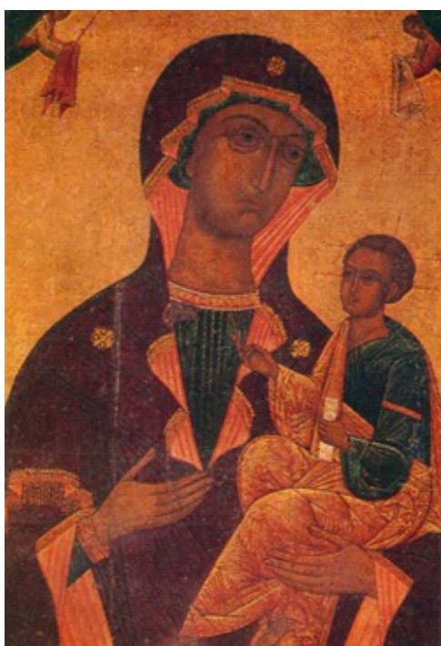
Маці Божая Ерусалімская XVI ст., Варварына царква, Пінск, знаходзіцца ў Нацыянальным мастацкім музеі Беларусі