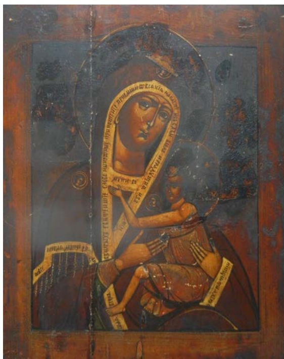
Багамацер Усяпетая, к. XIX — пач. XX ст., абраз адносіцца да іканаграфічнага тыпу “Замілаванне”, захоўваецца ў гісторыка-культурным музеі-запаведніку “Заслаўе”

тканінай. Для беларускіх абразоў разглядаемага часу адметным з'яўляецца шырокае выкарыстанне дэкаратыўна-пластычных сродкаў: разьбы, лепкі, афарбоўкі фону, разнастайных накладных элементаў, пакрыцця жывапіснай паверхні ахоўным лакам з яечнага бялку альбо смалы. У адрозненне ад станковага жывапісу іканаграфія арганічна ўваходзіла ў адзіны ідэйна-мастацкі комплекс з архітэктурай, дэкаратыўна-прыкладным мастацтвам і выконвалася звычайна для канкрэтнага месца – ансамбля іканастаса ў праваслаўных і каталіцкіх храмах.