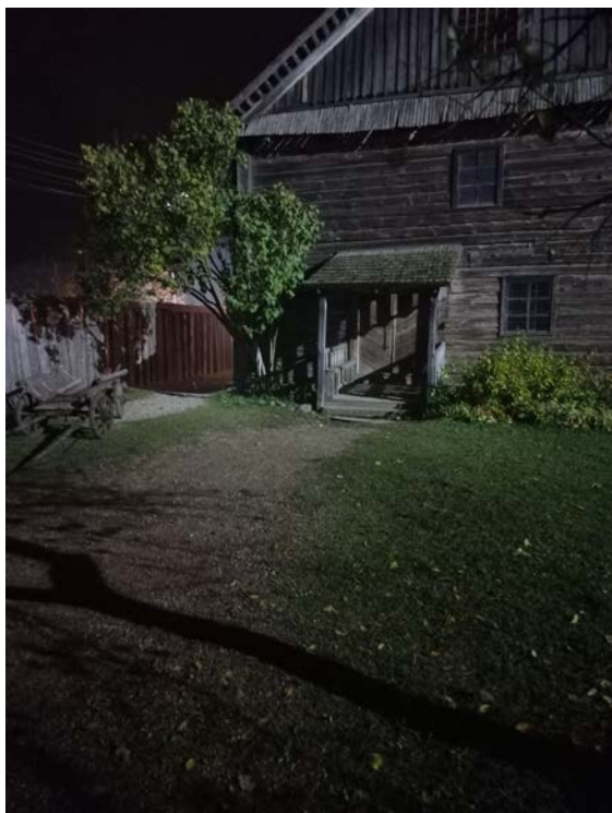
Позневечаровыя кіназдымкі на этнаграфічным комплексе. Млын

На этнаграфічным комплексе нашага музея-запаведніка ўвечары 26-га кастрычніка РУП “Нацыянальная кінастудыя “Беларусьфільм” здзяйсняліся здымкі эпизодаў фільма “Мы едины” (кінарэжысёр-пастаноўшчык – Андрэй Хрулёў; галоўны герой (персанаж) фільма – Павел Бойка).