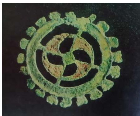
Фібула III-IV стст. *

Многія мясцовыя жыхары і госці Заслаўя яшчэ маюць у сваіх успамінах згадку пра тое, што ў будынку сучаснага Кафедральнага сабора Праабражэння Гасподня ў Заслаўі (помнік архітэктуры другой паловы XVI – пачатку XVII стст., гісторыка-культурная каштоўнасць 1-й катэгорыі) пэўны час размяшчаўся музей. Людзі згадваюць пра вялікую колькасць аўтобусаў з турыстамі побач з гэтым музеем, пра нейкія асобныя экспанаты, якія іх уразілі, высокую вежу, па прыступках якой было нялёгка падняцца, але, часта, не памятаюць і не могуць уявіць агулам, што гэта быў за музей. А гэта, між іншым, была ўстанова з высокім статусам – музей рамёстваў і народных промыслаў, філіял Дзяржаўнага музея БССР, статусам рэспубліканскага ўзроўню. Існаваў згаданы філіял у мурах Заслаўскай святыні з 1970-х гг. да 1990 г.