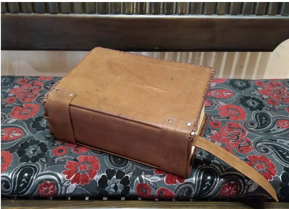
Кніга водгукаў музея-запаведніка, якая захоўваецца ў музейна-выставачным комплексе

“Дзякуем за працу! Жадаем росквіту, цікавых падзей, экспанатаў і наведвальнікаў! Вялікі дзякуй за выставу “АСОБА” Анастасіі Балыш, таму што гісторыя краю і краіны – гэта людзі, іх жыццёвы шлях, адносіны да сям’і, працы і месца! Шанаваць сваё – наша Нацыянальная ідэя!” (Таццяна Караткевіч, 25 чэрвеня).