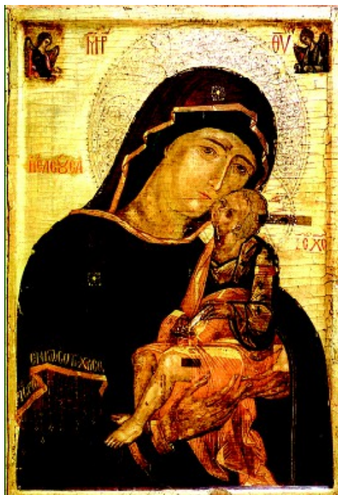
Маці Божая Замілаванне з Маларыты (XIV ст.), месцазнаходжанне абраза невядомае

Яго ўшаноўвалі, перад ім чыталіся малітвы. Абраз з'яўляўся культавым прадметам, які праецыраваў духоўную сувязь паміж чалавекам і Богам. Звяртаючыся да Бога з просьбай, пакаяннем, чалавек звяртаўся да абраза, які павінен быў “чуць” яго словы і не толькі чуць, але і дапамагаць ажыццяўляць тое, да чаго быў звернуты позірк чалавека.