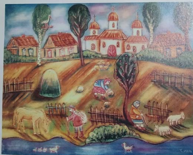
Сяргей Каваль. Мая вёска Якімава Слабада. 2005

Ілюстрацыі да даклада Ю.Л. Малаша са зборніка “Старажытныя гарады: праблемы даследавання, музейфікацыі, захавання помнікаў і гістарычных тэрыторый”; першая выява (зверху-ўніз): дыван Алены Кіш “Дзева на водах”, 1930-1940-я гг.; другая – дыван Сяргея Каваля “Мая вёска Якімава Слабада”, 2005 г.