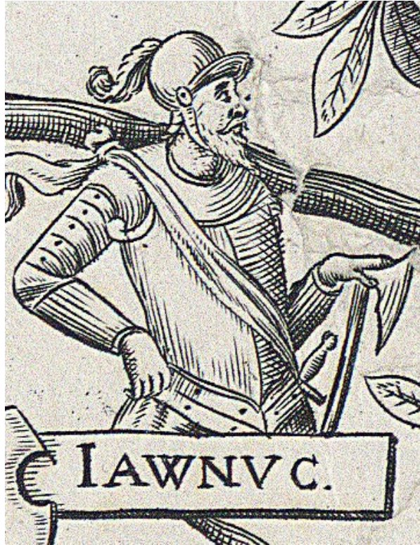
Яўнут Гедзімінавіч. Работа гравера Аляксандра Тарасевіча, XVII ст.

Спадчыннікі Яўнута Гедзімінавіча сталі звацца князямі Заслаўскімі і валодалі Заслаўем і яго ваколіцамі аж да той пары, як апошняя з роду князёў Заслаўскіх – Ганна Фёдараўна стала жонкай Яна Юр'евіча Глябовіча , пасля чаго Заслаўе перайшло ва ўласнасць Глябовічаў [1, с. 61, 65, 78, 80; 2, с. 442].