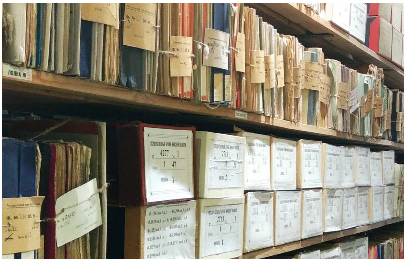
Пакой захоўвання дакументаў архіва

На пачатак 2022 г. на захоўванні ў архіве знаходзілася 5940 фондаў, 1 466 813 справы, па колькасці адзінак захоўвання (спраў) архіў з'яўляецца найбуйнейшым у Рэспубліцы Беларусь.