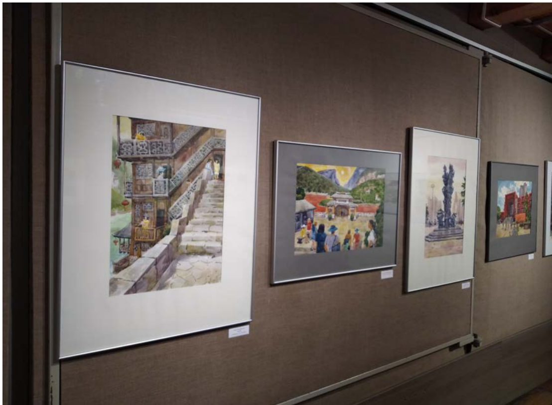
Да кітайскіх краявідаў або Усходняя тэма на выставе

зробіць прыемны падарунак аматарам мастацтва, паказаць плён сваёй працы, захапіць сваім натхненнем і аўтарскім бачаннем.