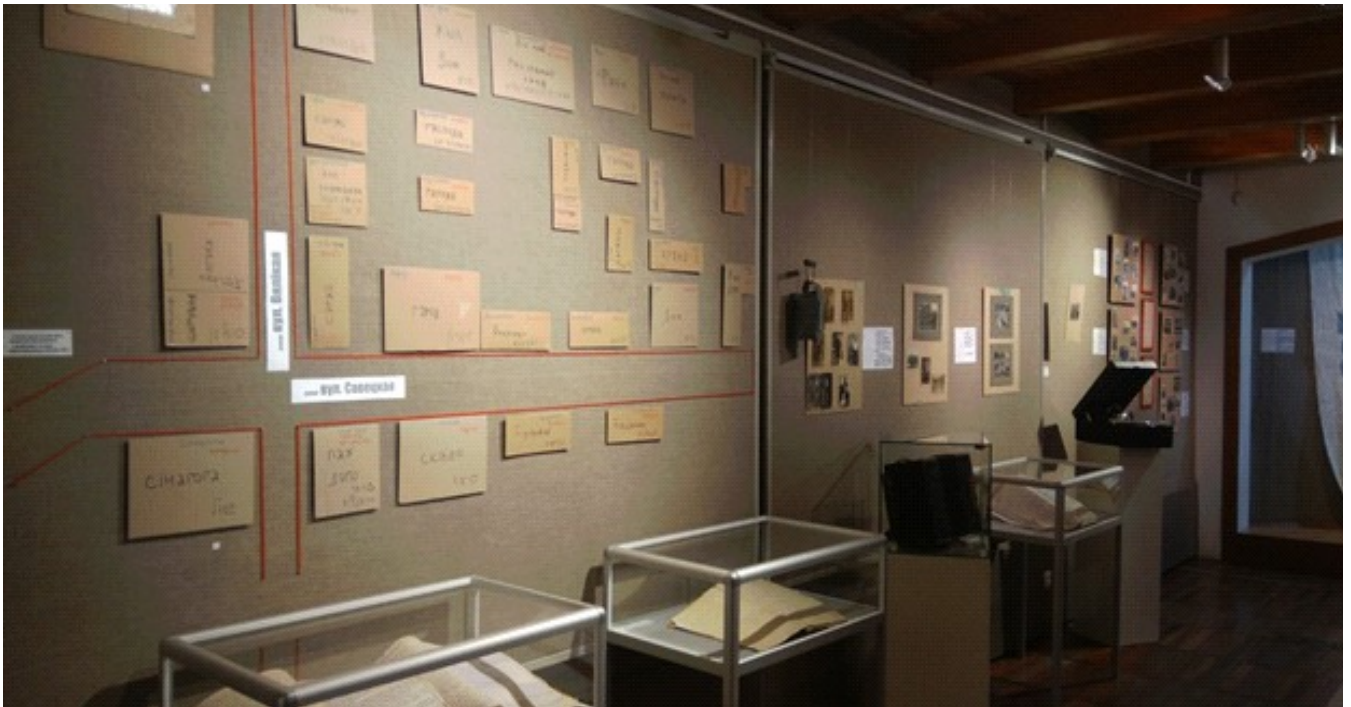
Частка экспазіцыі сумеснага выставачнага праекта ў музеі-запаведніку з архіўнымі дакументам

Такім чынам, сумесны выставачны праект уяўляў з сябе рознабаковае даследаванне-аповед пра гісторыю Заслаўя і Заслаўскага раёна за перыяд з 1920-ых па 1959-ы гг. Такая супраца музея-запаведніка з архіўнымі ўстановамі яшчэ раз — і ўжо не ўпершыню, — пацвердзіла выдатны вынік сумесных намаганняў ў вяртанні да мінулага і практык аповеду пра яго.