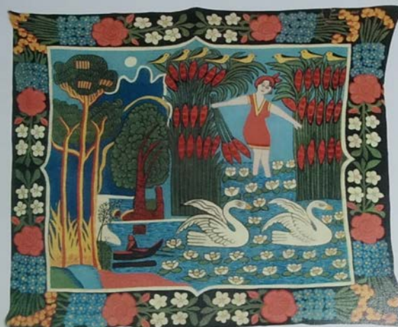
Алена Кіш. Дзева на водах. 1930 – 1940

гэты час адбываецца “адкрыццё” грузінскага мастака М. Пірасманішвілі (Пірасмані). Узнікае паняцце “прымітывісты” і “неапрымітывісты”. Апошнім называюць прафесійных мастакоў, якія ствараюць свае працы не па класічных канонах прафесійнага мастацтва (так званага акадэмізму), а з адпаведным ухілам у бок народнага мастацтва (наіўныя па першаму ўспрыманню, часцей плоскасныя, але шматперспектыўныя па кампазіцыі і зместу, алегарычныя, стрыманыя ці ўзмоцненыя па каларыце).