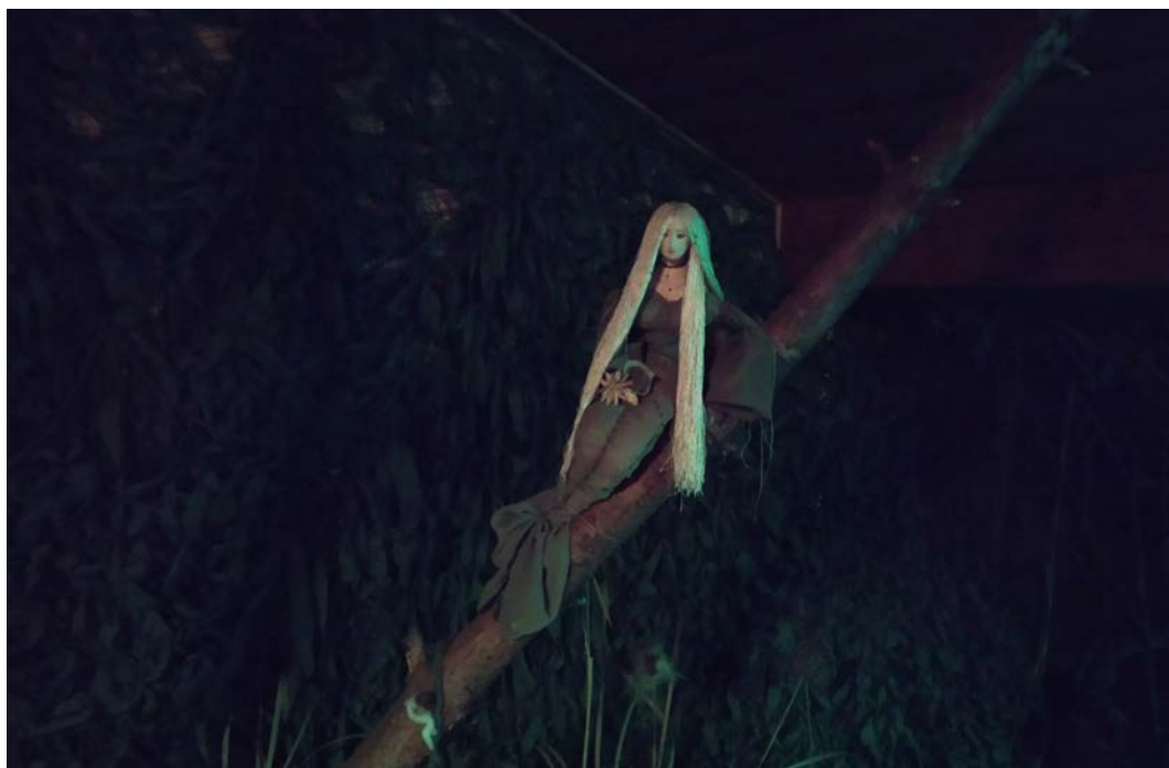
Русалка ў экспазіцыі Дзіцячага музея міфалогіі і лесу

человеку нужно было не смотреть им в глаза, чтобы не попасть под их чары и не стать их безвольной жертвой. Также, чтобы спастись от русалок, можно было начертить на земле крест, очертив его кругом, и находиться внутри данного круга.