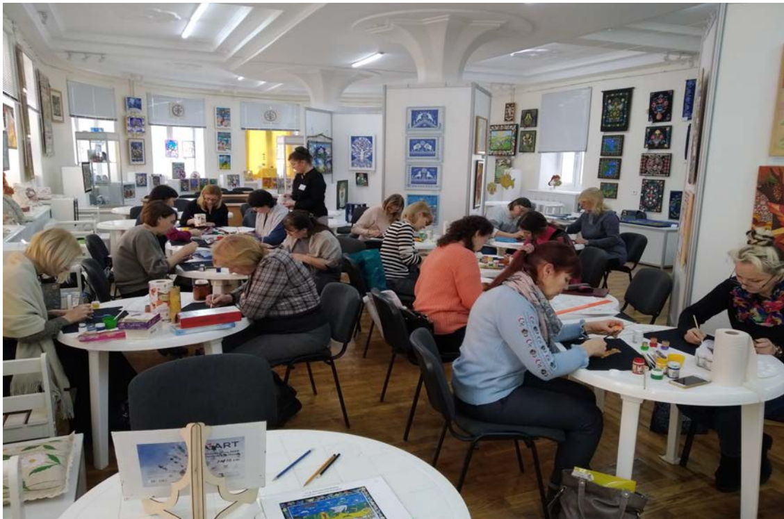
Нацыянальны цэнтр мастацкай творчасці дзяцей і моладзі, г. Мінск. Рэспубліканскі майстар-клас. За працай

мастацкай творчасці дзяцей і моладзі, дзе былі прадстаўлены дзіцячыя работы, створаныя ў стылі народнага роспісу тканіны, дрэва і шкла. Гэта былі лепшыя творы выхаванцаў Цэнтраў творчасці дзяцей і моладзі з усёй Беларусі.