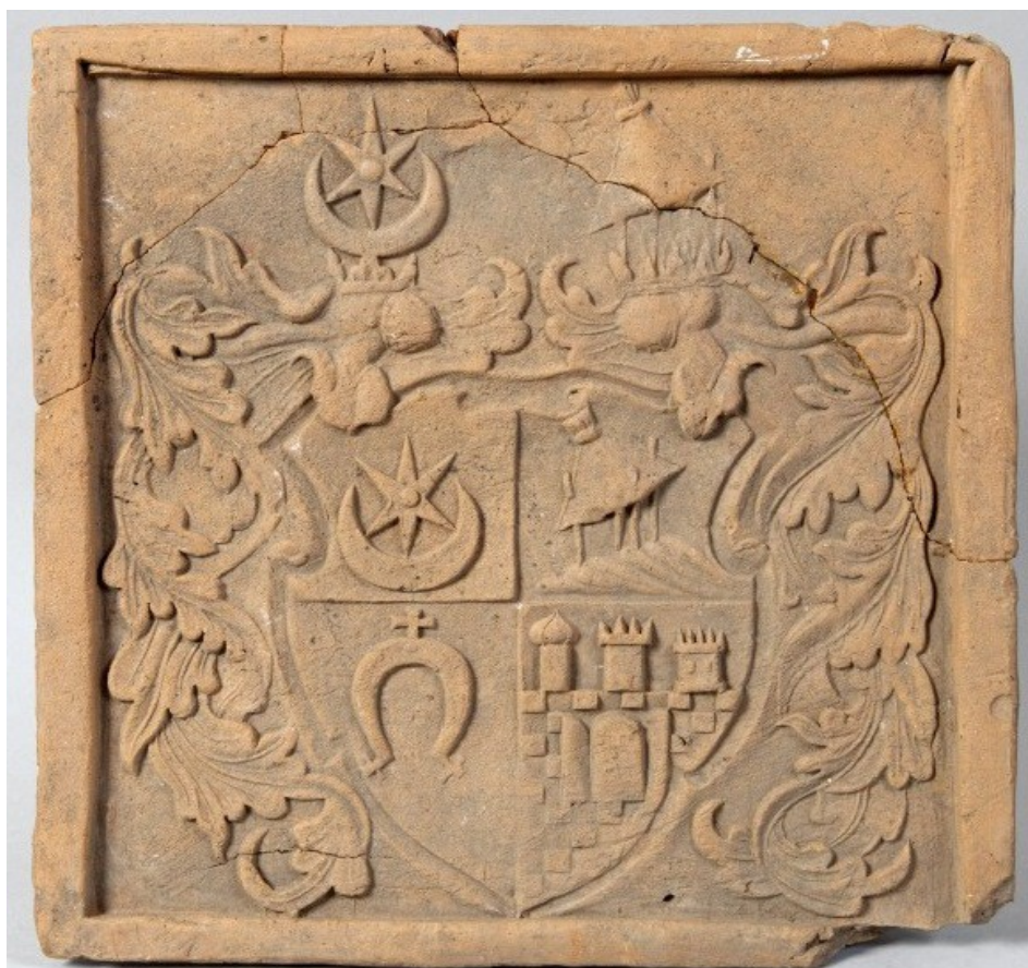
Кафля з адбіткам сумеснага герба Я. Глябовіча і К. Кратоўскай, XVI ст. Выяўлена Заслаўскай археалагічнай экспедыцыяй у 1980-х гг. Захоўваецца ў Нацыянальным гістарычным музеі Беларусі

Ганна Фёдарайна Заслаўская (? – 1571), апошняя з Заслаўскіх. Яе бацька – Фёдар Іванавіч (каля 1470 – 1538 гг.) быў намеснікам віцебскім, з 1494 па 1499 гг. – намеснікам бранскім, з 1501 па 1538 гг. – старастам і дзяржаўцам аршанскім. Маці – Соф'я Андрэеўна Сангушка , пляменніца славутага палкаводца і вялікага гетмана Канстанціна Астрожскага . Сястра Ганны памерла рана, і ёй дасталіся ўсе маёнткі бацькоў, у тым ліку з трэцяй часткай Заслаўя і замка (горад быў падзелены паміж 9 уласнікамі, нашчадкамі братоў бацькі – Міхаілам і Багданам , найбольш значнай была доля Ганны Фёдарайны).