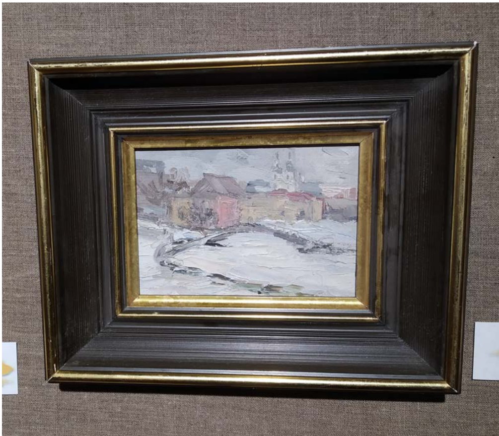
Валерый Юзвук. Эцюд, кардон, алей, 2001 г.

адкаванья са сталі ружы і нажы (“куячкі”), якія нібыта паядналися з каларытам старажытнай эпохі, сталі яе матэрыяльнай візуалізацыяй.