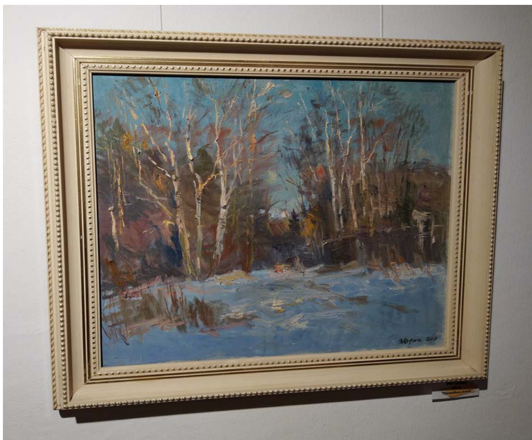
Валерый Юзвук. "Лістапад", палатно, алей, 2003 г.

Валерый Юзвук – вядомы беларускі мастак, які паходзіў родам з г. Мінска, на працягу многіх гадоў быў сябрам Беларускага саюза мастакоў (БСМ). Карціны Валерыя Юзвук захоўваюцца як у шэрагу айчынных калекцый, так і ў замежных, належаць як установам, так і прыватным асобам.