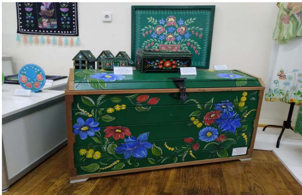
Дзіцячыя работы на выставе “Чароўныя ўзоры”. У цэнтры – работа “Куфэрак Карэліцкай паненкі”, выкананая Ульянай Розінай (вучаніцай ДУА “Карэліцкі раённы цэнтр творчасці дзяцей і моладзі”)