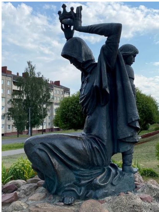
Помнік Рагнедзе і Ізяславу, усталяваны ў 1993 г.; перасунуты бліжэй да ўвахода ў Дом культуры ў 2014 г.

Захаванне гісторыі і культуры Айчыны – гэта, без пераўвелічэння, частка дзяржаўнай праграмы, якая ўплывае на патрыятычнае выхаванне насельніцтва, складаванне чалавека як асобы і грамадзяніна. Дадзеная праграма рэалізуецца на працягу многіх дзесяцігоддзяў і складваецца з самых разнастайных накірункаў. Адным з такіх накірункаў з'яўляецца стварэнне помнікаў, а асабліва – скульптурных кампазіцый або скульптур, прысвечаных гістарычным асобам. Дадзены тып помнікаў з'яўляецца вельмі ўдалым з пункту гледжання ўздзеяння на гледача, яго эмоцыі, на складаванне ўяўлення аб вобразах гістарычных персанажаў, атаясамлення помнікаў з месцам (населеным пунктам; асацыятыўная прывязка), у якім ён усталяваны. Далёка не кожны населены пункт Беларусі на дадзены момант можа пахваліцца наяўнасцю ўдалых помнікаў у выглядзе скульптур і скульптурных кампазіцый. Заслаўю ж у згаданым вышэй сэнсе пашчасціла, і гэта невыпадкова, бо тут выявілася даніна вялікаму значэнню Заслаўя ў гісторыі і культуры Беларусі, аб чым і працягнем разважаць ніжэй.