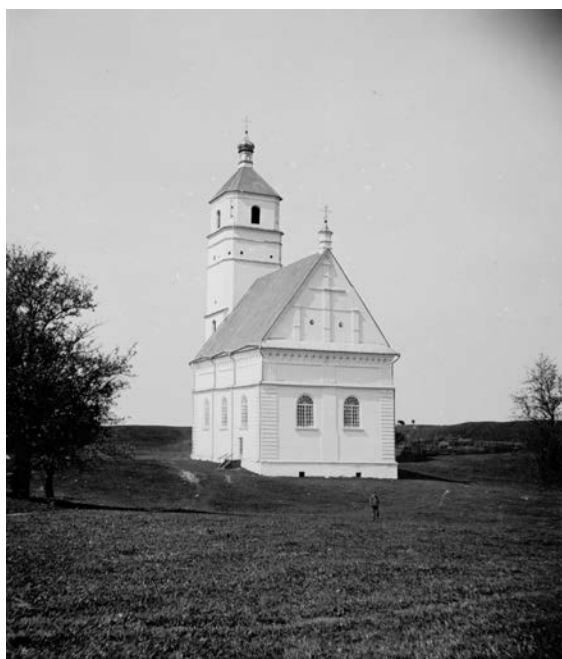
На конец XVIII – пер. пол. XIX — доминиканский костел Михаила Архангела, затем — “подоминиканская” (доставшаяся от (после) доминиканцев — [ред.]) православная церковь; фото 1900 г., автор неизвестен

После присоединения территории Минщины к Российской империи в 1793 г. католики вошли в состав Заславской католической парашии Минского деканата Минской католической епархии. По сообщению польского “Географического Словаря...”, в первой половине XIX в. Заславская католическая парашия насчитывала до 2000 верующих. А в Заславле был костел Св. Николая, а также католические каплицы Свв. Космы и Дамиана в Мацках, Шаповалах, Чайковщизне и Гурках [3]. В 1854 г. в парашии было 2724 прихожан [4].