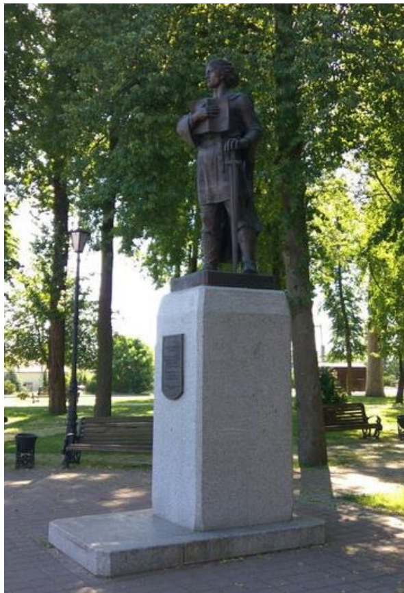
Помнік князю Ізяславу, усталяваны ў 2014 г.