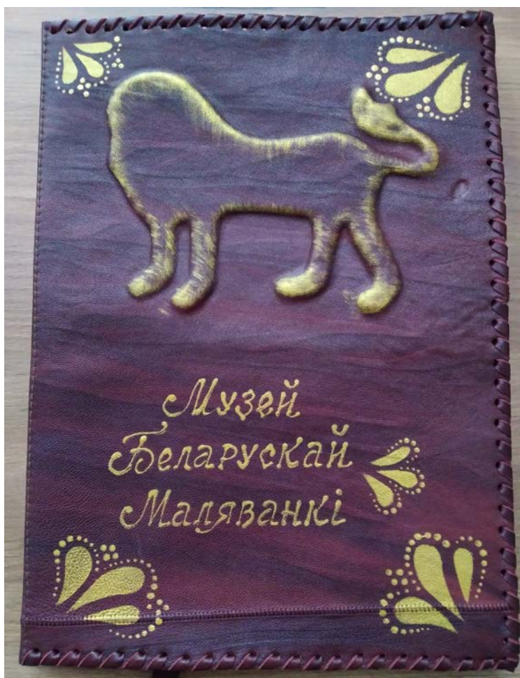
Вкладка кнігі водгукаў Музея беларускай маляванкі /аўтар арыгінальнай вкладки – заслаўскі майстар Наталля Бічэўская/

“Дзякуй вялікі ўсім, хто задумаў, сабраў, пабудаваў і адкрыў музей беларускай маляванкі. Я асабіста ведала сп. Юрася Малаша, ініцыятара збору маляваных дываноў і спадчыны Язэпа Драздовіча. Я думаю, ён на небе радуецца, што яго мара споўнілася. Дзякуй адміністрацыі Заслаўскага музея за новы ўнікальны музей, у якім захоўваецца культурны код беларускага народа – прага да Бога, любові і гармоніі” (сям'я Дайнекаў, 20 мая).