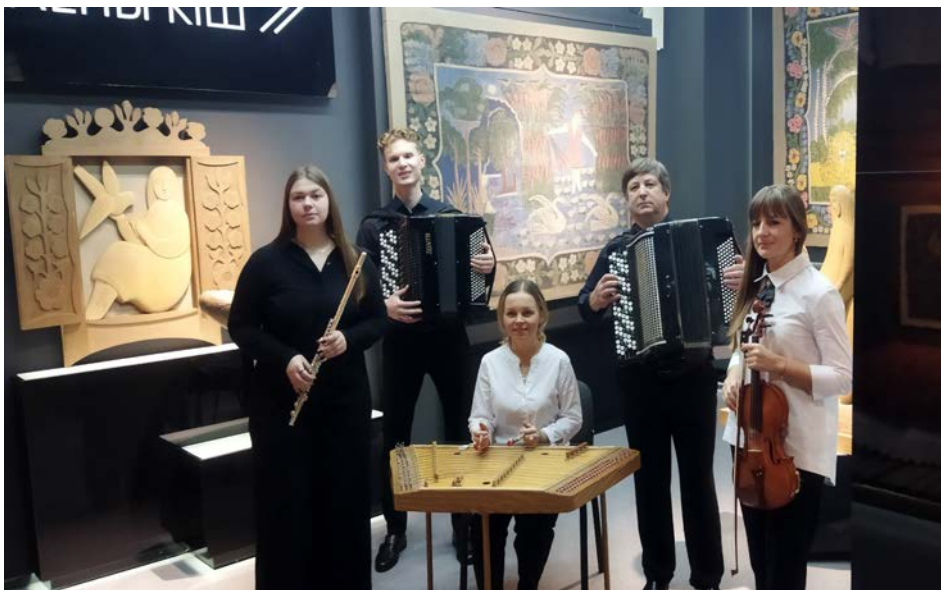
Госці ў Музеі беларускай маляванкі.

Прыемна, што Музей-запаведнік знайшоў сваё адлюстраванне ў агульным прадстаўленні культурнай разнастайнасці Мінскага раёна.