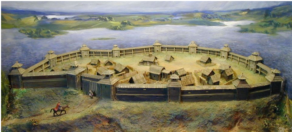
Макет Браслаўскага замка. Гістарычна-краязнаўчы музей Навукова-даследчай установы культуры “Браслаўскае раённае аб’яднанне музеяў”

У Брачыслава быў сын Усяслаў, вядомы ў гістарыяграфіі як Усяслаў Чарадзей. Пры Усяславе Полацкае княства набыло асаблівую магутнасць. Пры ім быў збудаваны Сафійскі сабор, падобных якому больш нідзе не будавалася на беларускіх землях, з яго ж княжаннем звязана і першая згадка ў летапісах пад 1067 г. пра г. Мінск (старажытны Менск).