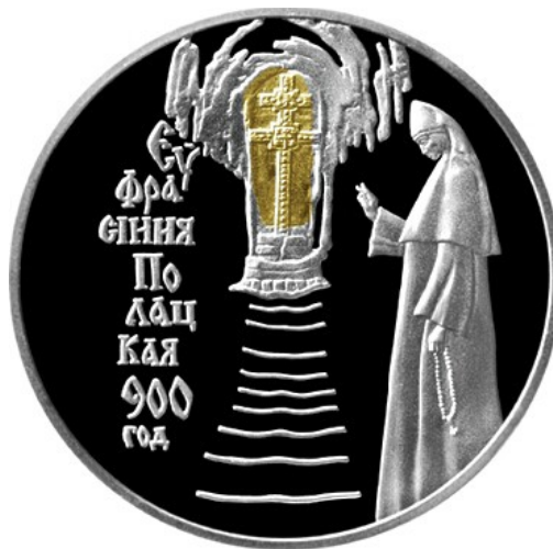
Памятная манета з выявай Еўфрасінні Полацкай і Яе крыжа. НБРБ, 2001 г.

Нашчадкі князя Ізяслава (Ізяславічы), як мы бачым нават з асобных згадак, прыведзеных вышэй, зрабілі каштоўны ўнёсак у скарбонку гісторыі і культуры Беларусі, а, значыць, у гэтым ёсць, хай і ўскосны, але заслужылі след. Каб адчуць яго, трэба прыехаць у тыя мясціны, дзе калісьці жылі Ізяслаў і яго маці Рагнеда (Гарыслава, Анастасія), падняцца на вал старажытнага Ізяслаўля (гарадзішча “Замачак”/“Замэчак”), паглядзець з яго вышыні на заслужылія святыні – Кафедральны сабор Праабражэння Гасподня і Парафіяльны касцёл Нараджэння Найсвяцейшай Панны Марыі. Зараз гэта зрабіць асабліва зручна: лісце з дрэваў даўно апала, таму лёгка можна сягаць зацікаўленым вокам у вакольныя далягляды.