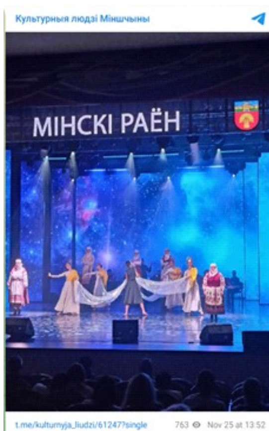
Кампазіцыя “Песня аб райскім жыцці”, XIX-ы абласны фестываль “Напеў зямлі маёй” (г. Барысаў)

Дарэчы, выступоўцы сталі лепшымі ў намінацыі “За творчае ўвасабленне гістарычнай тэматыкі”, магчыма, у тым ліку і дзякуючы таму ўнёску, які робіць Музей-запаведнік у захаванне гістарычнай і культурнай спадчыны, яе трансляцыю сродкамі музейнай экспазіцыі.