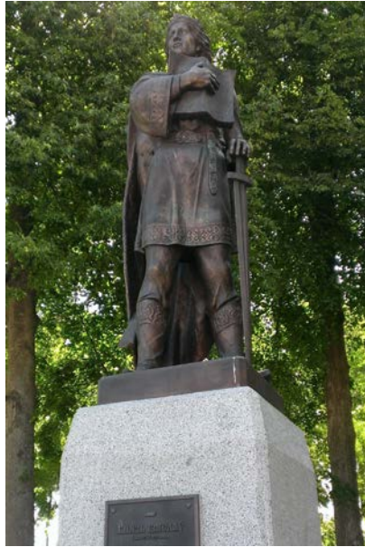
Помнік князю Ізяславу на Рынкавай плошчы ў Заслаўі