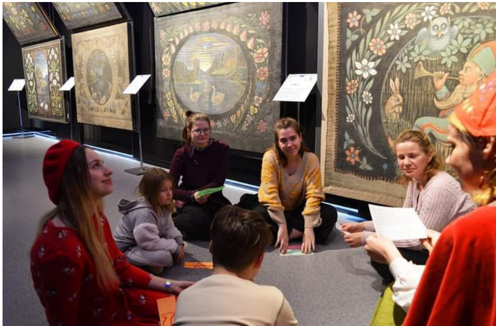
Занятак клуба, прысвечаны казачным персанажам – Красналюдкам