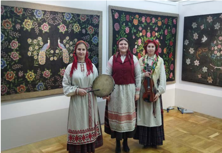
Госці ў Музеі беларускай маляванкі.

нашых гасцей і ў Музеі беларускай маляванкі, а таксама – у Музейна-выставачным комплексе.